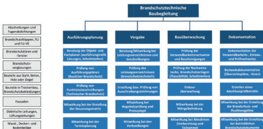
Projektstrukturplan für die brandschutztechnische Baubegleitung

bedarf es einer durchdachten Systematik im Sinne eines Managementsystems. Managementsysteme zeichnen sich generell durch bestimmte Grundsätze, eine definierte Art der Dokumentation sowie durch eine systematische inhaltliche Gliederung aus. Wesentliche gemeinsame Merkmale gängiger Qualitäts- bzw. Projektmanagementsysteme sind der prozessorientierte Ansatz sowie der Grundsatz der kontinuierlichen Verbesserung. Die Dokumentation erfolgt in Form eines Qualitäts- bzw. Projektmanagementhandbuchs sowie untergeordneter Dokumente wie Prozessbeschreibungen, Checklisten etc.